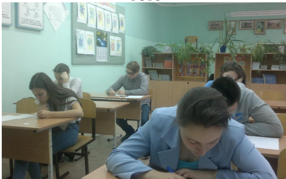
Муниципальный этап ВсОШ по математике 15.11.2018 г.