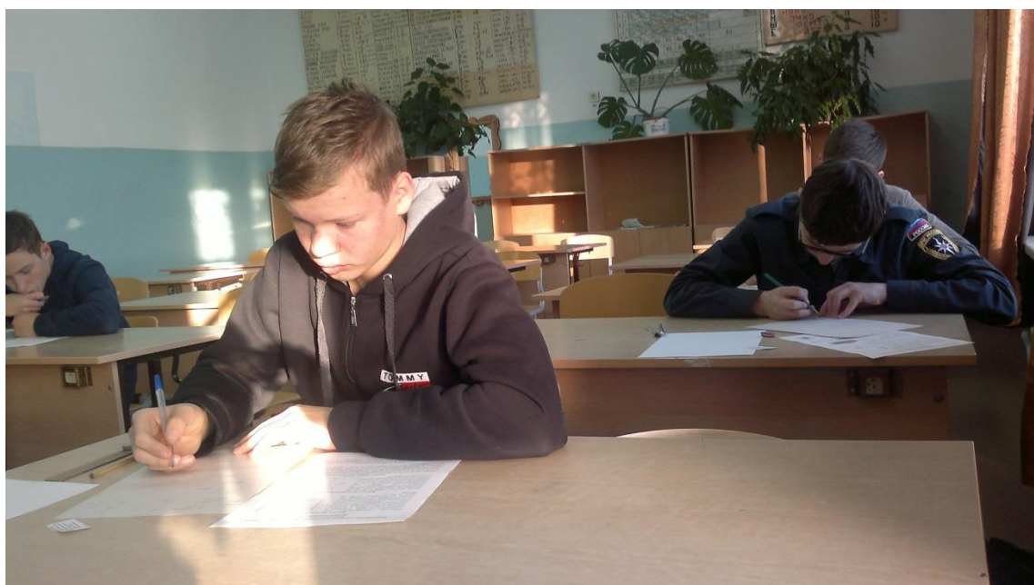
Муниципальный этап ВсОШ по физике 22.11.2018 г.