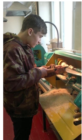
Муниципальный этап ВсОШ по технологии 29-30.11.2018 г.